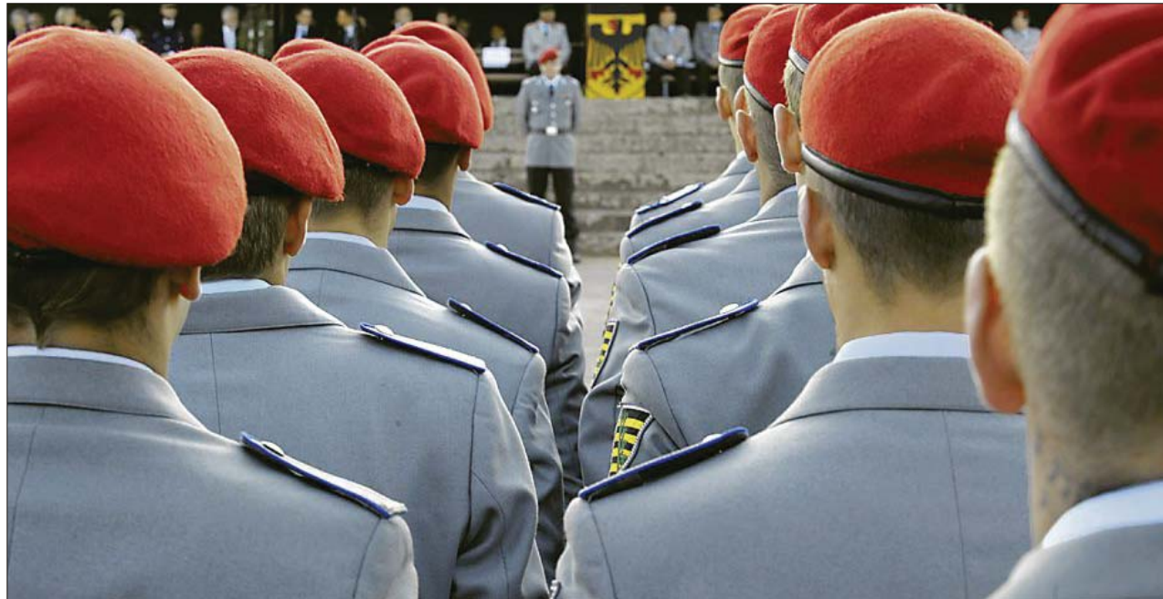
Die Soldaten der Bundeswehr blicken am heutigen Mittwoch gespannt nach Berlin.

Bayerns Ministerpräsident Horst Seehofer (CSU) pochte indessen auf einen Beitrag der Bundesregierung zur Linderung der Folgen von Standortschließungen. Seehofer sagte in München, die betroffenen Kommunen bräuchten eine Unterstützung. Dabei müsse sich auch der Bund „anstrengen“. Er hoffe, dass dies unumstritten sei.