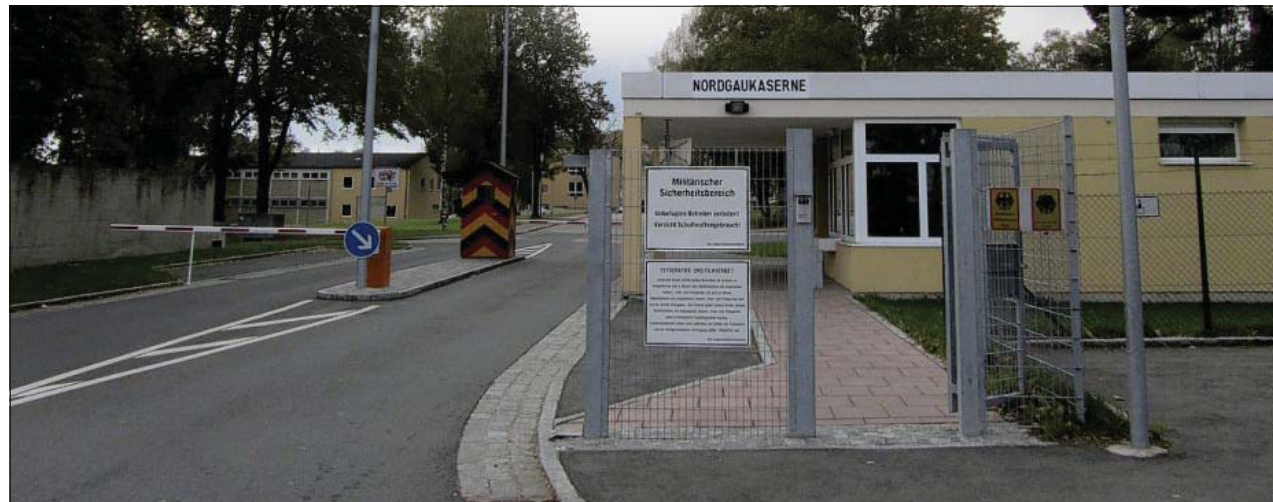
In die Nordgaukaserne zieht der erweiterte Führungsstab der Panzerbrigade 12 ein.

Offenbar zugunsten der Chamer Kaserne. Denn anfangs sah es für den Standort im Stadtteil Nunsting wirklich nicht gut aus. Der Hintergrund: Die Fernmelderverbände werden bundesweit drastisch ge-