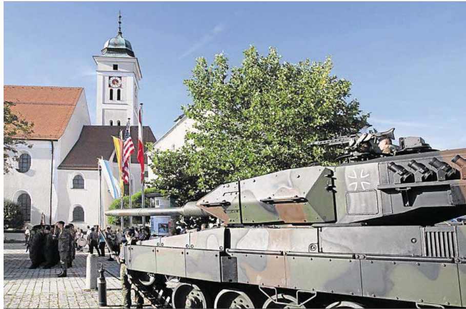
Auch in Pfreimd (Kreis Schwandorf) wartet man heute gespannt auf die Standortentscheidungen von Verteidigungsminister Thomas de Maizière (CDU). In der Stadt ist unter anderem das Panzerbataillon 104 stationiert. Die Zahl der Dienstposten liegt bei 46 zivilen Stellen und 832 Soldaten.