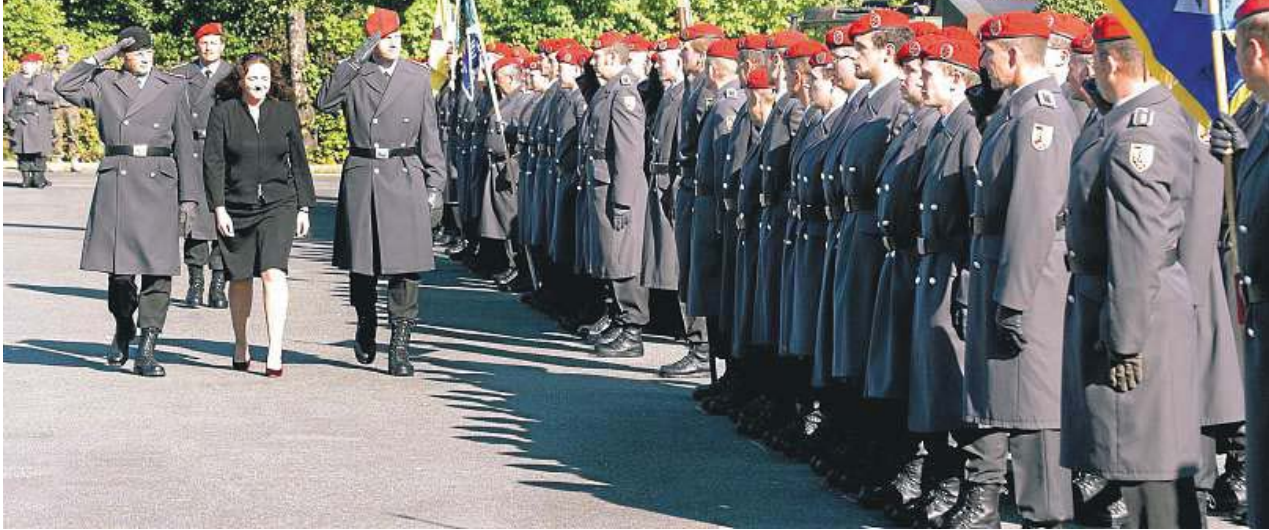
Hat beim letzten Appell schon die Schließung des Standortes ihren Schatten vorausgeworfen? – Bis Dienstagabend gab es nur Gerüchte.